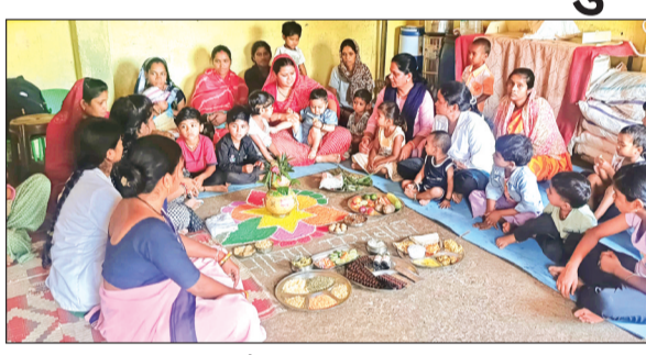
हरिभूमि न्यूज ►► सोहागपुर

महिला एवं बाल विकास विभाग के निर्देशानुसार पचमढ़ी सेक्टर के आंगनबाड़ी केंद्र नर्मदापुरम 06 एवं 08 में 'नारी शक्ति वंदन' और 'पोषण पखवाड़ा' का उस्तसहपूर्वक आयोजन किया गया। इस दौरान निर्धारित थीम के आधार पर माता-पिता के लिए ईसीसीई एवं प्रारंभिक देखभाल सत्र आयोजित किया गया, जिसमें बच्चों के सर्वांगीण विकास पर जोर दिया गया। कार्यक्रम की मुख्य थीम 'प्रारंभिक मस्तिष्क विकास' पर केंद्रित रही। उपस्थित अभिभावकों को जानकारी दी गई कि जीवन के शुरुआती वर्षों में बच्चों के मस्तिष्क का विकास सबसे तीव्र गति से होता है, इसलिए इस दौरान सही पोषण और भावनात्मक