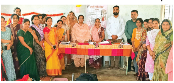
हरिभूमि न्यूज ►► माखननगर