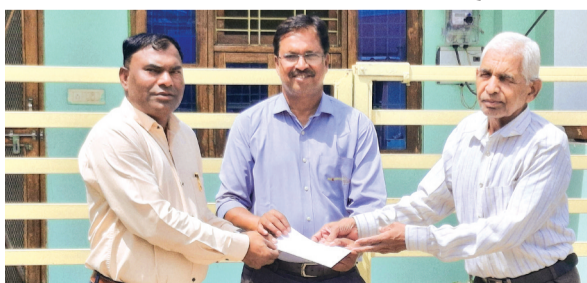
हरिभूमि न्यूज ►► सिवनी मालवा

शिक्षा मां के पेट से जन्म नहीं लेती, उसके लिए अनुकूल परिवेश, आर्थिक मानसिक, शारीरिक स्थिति की आवश्यकता होती है शिक्षा ही मानव का सर्वांगीण विकास करती है। शिक्षा के बिना मानव का बौद्धिक, शारीरिक मानसिक विकास नहीं होता। इसी कड़वी सच्चाई को दूर करने के लिए मंगलमय विलास कॉलोनी,