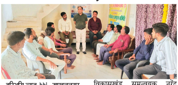
हरिभूमि न्यूज ►► माखननगर

मध्यप्रदेश जन अभियान परिषद् की नवांकर संस्था गुरुदेव शिक्षा एवं समाज सेवा समिति एवं ग्राम विकास प्रफुटन समिति गुजरवाड़ा ने सेक्टर क्रमांक - 04 में जल गंगा संवर्धन अभियान के द्वितीय चरण श्रमज श्रौत सेवा संगमम अभियान के अंतर्गत ग्राम गुजरवाड़ा में जल चौपाल एवं जल संरक्षण शपथ का आयोजन किया गया जिसमें