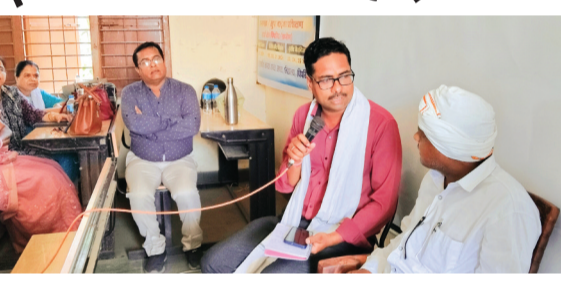
हरिभूमि न्यूज ►► सोहागपुर