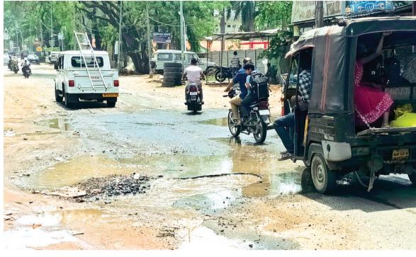
हरिभूमि न्यूज ►► सोहागपुर

शहर में सीएम राइस स्कूल के समीप स्टेट हाईवे पर जल भराव समस्या तीन वर्षों से है। नागरिक परेशान हैं तथा दुर्घटनाएं हो रही हैं। इस स्थिति में भी स्थानीय प्रशासन मूक दर्शक बना हुआ है। क्षेत्रीय नागरिकों ने इस स्थिति पर नाराजगी व्यक्त की है। नागरिकों ने बताया कि बारिश के मौसम में चंद मिनिटों की बरसात होने पर हाईवे पर लगभग 100 मीटर लंबाई