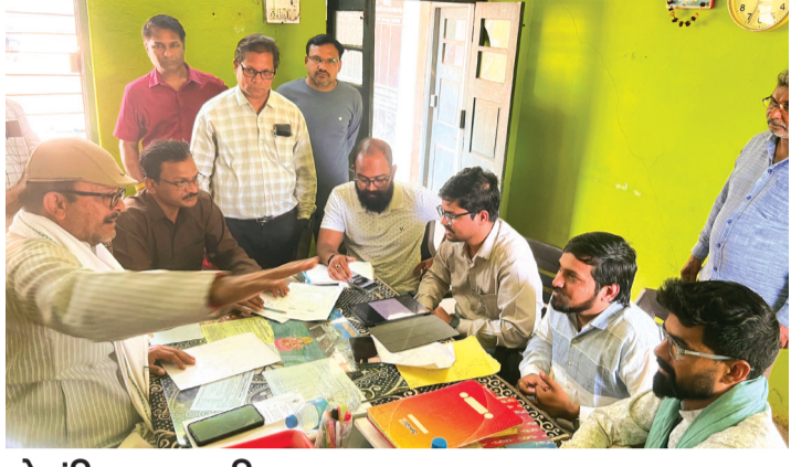
दो मंजिला आधुनिक भवन में मिलेगी आधुनिक सुविधाएं

राहर के कन्या महाविद्यालय में 10 करोड़ की लागत से बनने वाले भवन का कांटेक्टर और अधिकारियों ने स्थल निरीक्षण किया। इस दौरान नपाध्यक्ष ने निर्माण की गुणवत्ता, भविष्य की जरूरतों और व्यवस्थाओं को लेकर मौके पर ही दिशा-निर्देश दिए।